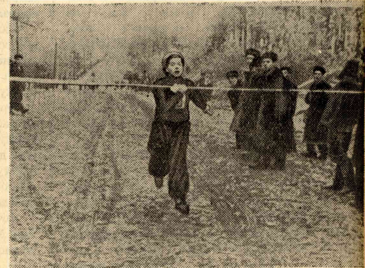
Финиширует представительница команды ГФ, занявшей первое место.