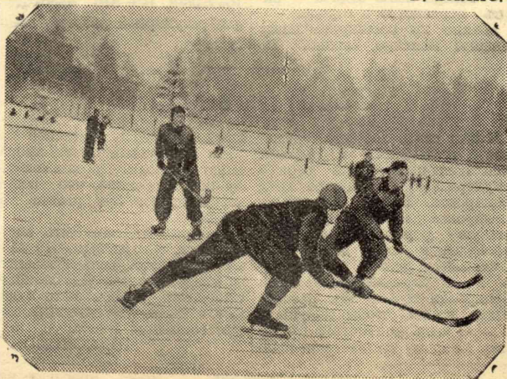
На снимке: момент игры в хоккей.