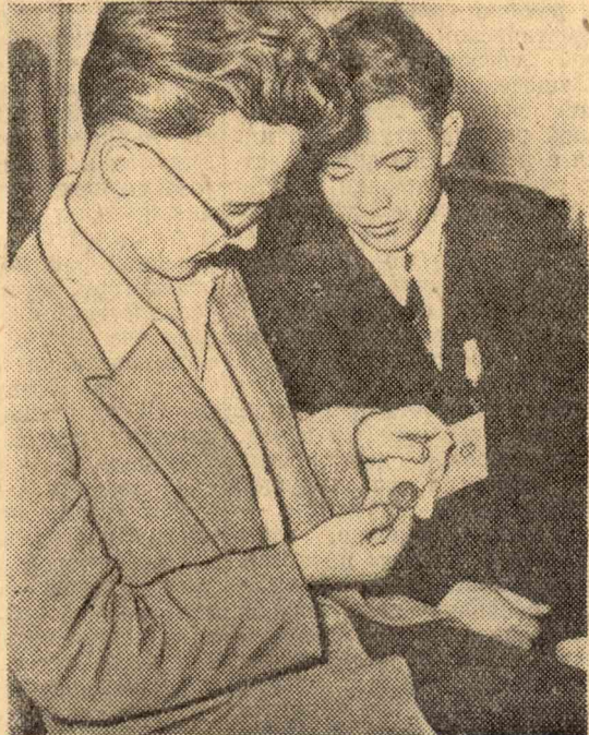
Ю. Феофелов и А. Пушкин рассматривают медаль.