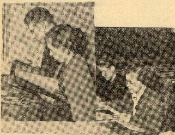
В зале книжной выставки.

Книжную выставку посетило свыше 5000 человек. Г. МЕЛЬНИКОВА.