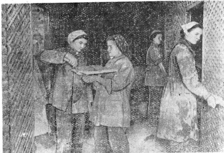
На снимке: бригада студентов-штукатуров на ремонте общежития № 6.