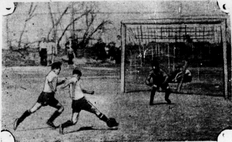
Футбольный матч между командами «Головной комитет» и «Секретари факультетских бюро»

завоевал наш институт. Он был награжден памятным знаменем Кировского райкома ВЛКСМ.