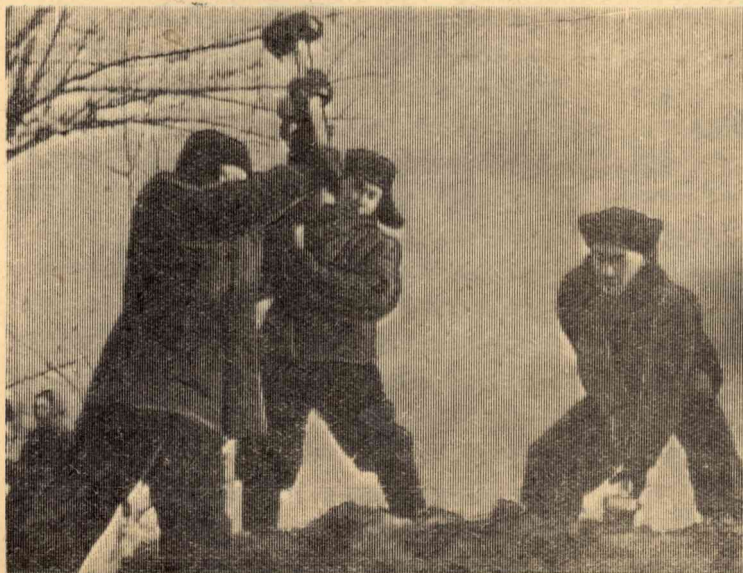
На снимке: студенты РТФ работают на геотрассе.