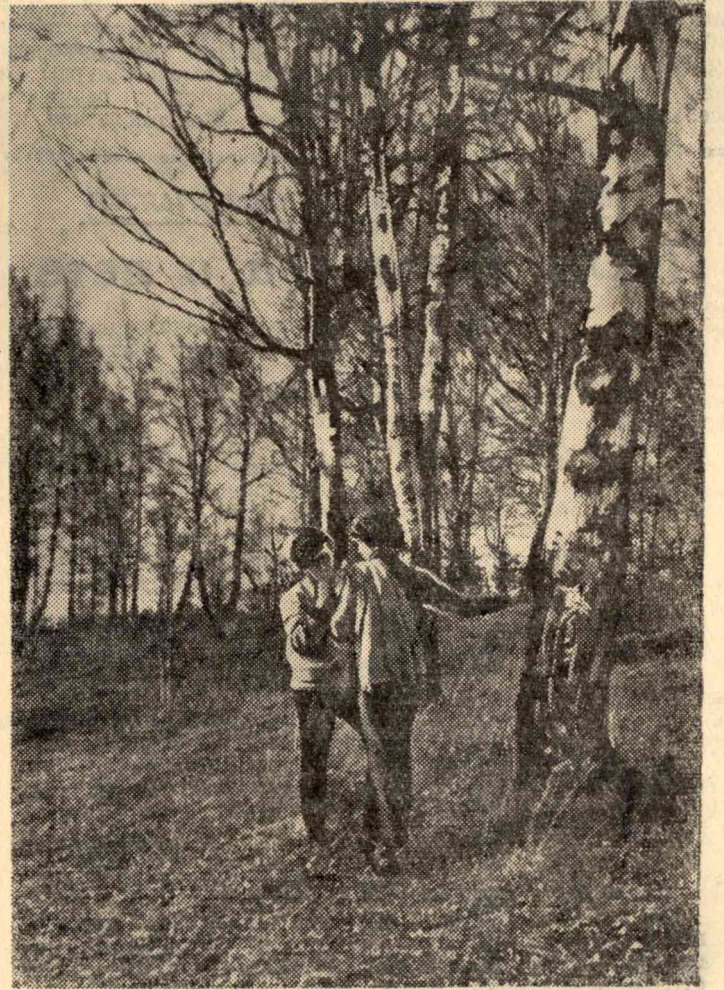
Весной в лесу