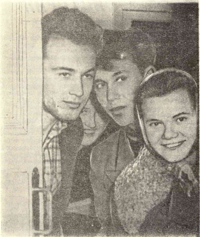
— НУ КАК?..