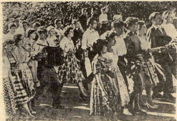
Звучат фестивальные песни...