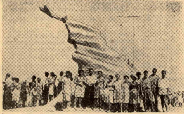
На снимке: г. Севастополь, у памятника советским летчикам — героям севастопольской обороны.

коммунизме, с тем чтобы оказать помощь азиатским, африканским и другим народам в создании социализма и коммунизма в своих странах. Она рассказала о заботе нашего правительства о жен-