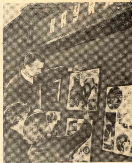
Ко дню выборов в местные Советы депутатов трудящихся г. Томска научно-техническая библиотека института оформила иллюстративный монтаж на тему: «НАУКА, МИР, КОММУНИЗМ», разместив его на стенде второго этажа главного корпуса.

Если каждый студент и студентка воспитают в себе волю и любовь к труду, организуют себя, будут аккуратно посещать все виды учебных занятий, систематически самостоятельно работать по учебным пособиям над изучением дисциплины учебного плана, выполнять домашние задания, то они будут гарантированы от всяких неприятных случайностей в период экзаменационной сессии. Таким студентам достаточно будет 2-3 дней для того, чтобы воскресить в памяти то, что было уже изучено ранее.