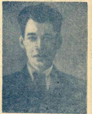
труженика, горячность сердца.

заведующий отделом агитации и пропаганды горкома ВЛКСМ, а затем горкома партии, и как руководитель лекторской группы обкома КПСС, и как преподаватель вуза. Во всех его делах всегда проявляется неутомимость