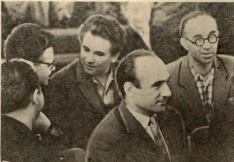
Перерыв заканчивается. Участники собрания расселись по местам. Обменяются впечатлениями.

ИЗРКСМ и комитет ВЛКСМ упустили этот вопрос. Кажется, было бы полезным создать специальный совет или сектор, который бы контролировал учебу хозстипендиатов. Может, и по студентам-рабочим следовало бы принять такие меры.