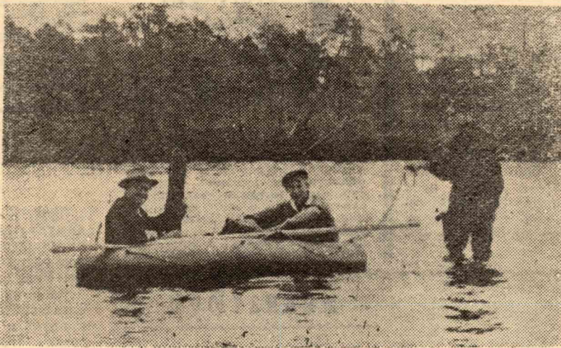
Хорошо провести воскресный день на Томи.

Наша местная «здравница» за летние каникулы пропустит через свою вкусную кухню 300 «курортников».