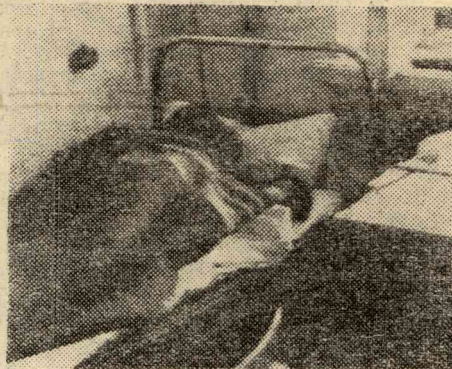
11-й час. В 411 комнате девушек ХТФ... Берегитесь! Сессия безжалостна и лебезит.

Пирогова, 18а — АВТФ. Трудом и только трудом можно добиться успехов. Студенты группы 1021 полностью с этим согласны. Это лучшая группа АВТФ по