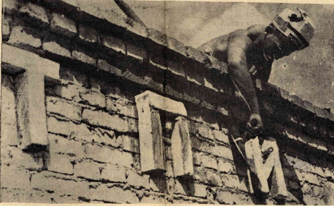
На всех объектах, сданных нашими студентами, красуются эти гордые буквы.