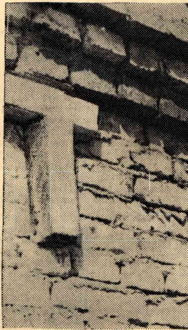
На всех объектах эти гордые буквы.