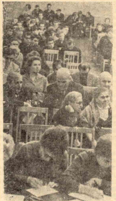
В зале профсоюзной конференции.