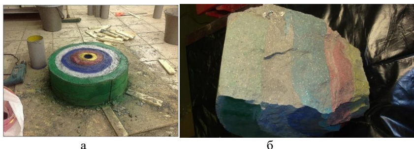
Рис. 1. а - внешний вид модели; б - внутренняя структура модели

Для обоснования численных расчетов модельные эксперименты проводились на цилиндрических блоках. При реализации модели зонного взрывного дробления первоначально была изготовлена съемная опалубка из пустотелых тонкостенных цилиндрических форм различного диаметра. Общее количество цилиндров составляет 6 штук. Радиус цилиндров изменяется от 10 до 100 относительных радиусов заряда ( \bar{r} ). Высота всех цилиндров составляет 80 относительных радиусов. Конструктивные параметры и общий вид модели представлены на рис. 1.