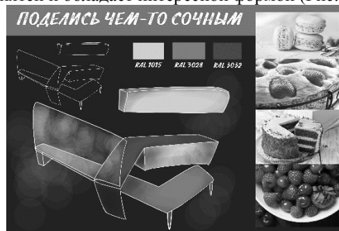
Рис.1. Утвержденный эскизный вариант

Следующий этап – эскизная разработка вариантов рабочего места. В ходе работы был утвержден один вариант, обладающий достаточным количеством рабочих поверхностей, различных по высоте и необходимым количеством мест для хранения. Вариант также эстетически приятен и обладает интересной формой (Рис. 1).