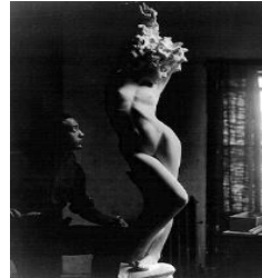
Рис.1. 1925 г. «Русалка»

случайности Ногучи попал в число учеников парижского скульптора Константина Бранкузи,