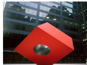
Рис.2. «Красный Куб»

Париже, создавая абстрактные скульптуры и абстрактные рисунки гуашью. В связи с тем, что в этом же году он получает грант Guggenheim Fellowships, выдававшийся тем, «кто демонстрировал исключительную способность в образовании или исключительные творческие способности в искусствах» Исаму Ногучи возвращается к Нью-Йорк. В 1930-ые годы он много путешествует по Америке и Японии, впитывая в себя культуры этих стран. В эти годы он также устраивает большое количество выставок своих работ: выставка парижских абстракций(1929), выставка портретной