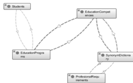
Рис. 1. Граф онтологической модели системы (фрагмент)

На рисунке 1 представлен фрагмент графа онтологической модели знаний системы.