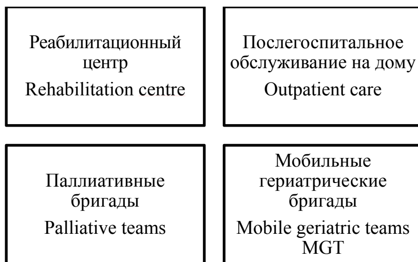
Рис. 4. Нововведения системы здравоохранения пожилых людей (г. Йенчепинг, Швеция). Составлено на основе [3, 4, 11, 18, 23]

В основном направления деятельности шведского госпиталя не отличаются от аналогичного российского. Однако следует выделить работы гериатрической клиники, что для российской действительности является новым и неизученным направлением. Гериатрическое отделение занимается лечением пожилых людей. Согласно Постановлению Правительства от 2005 года в Швеции приходится порядка 5,5 медицинских специалистов на каждые 100 тыс. жителей. В апреле 2016 года гериатрическое отделение в Рейхофе было реорганизовано, удалось сократить количество койко-мест с 55 в общем до 21. Такая оптимизация стала возможна благодаря нововведениям в области здравоохранения (рис. 4).