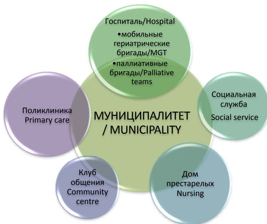
Рис. 5. Схема взаимодействия институтов социальной защиты и системы здравоохранения (г. Йенчепинг, Швеция) [11] Fig. 5. Interaction pattern between social and health care institutes in Jönköping, Sweden [11]