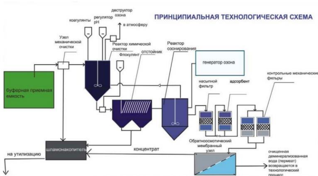
Рисунок 3 – Технологическая схема станции очистки стоков