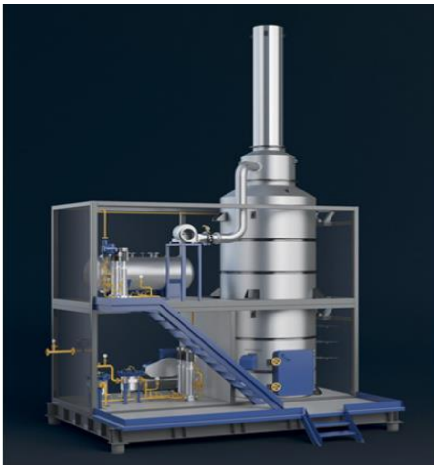
Рисунок 2 – КТО-2500.ПГНС

Блок комплекса для подогрева нефти и утилизации сточных (бытовых) вод предназначен для подогрева товарной нефти за счет тепла, образующегося при сжигании попутного нефтяного газа, поступающего от блока сепараторов в составе ЦПС В... месторождения, и утилизации сточных (бытовых) вод, поступающих со станции очистки сточных (бытовых) вод месторождения.