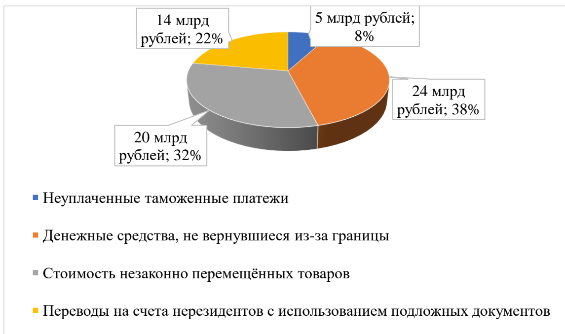
Диаграмма 1. Потери федерального бюджета РФ, причиной которых стали таможенные правонарушения в 2017 году 68

Возместить в рамках правоохранительной деятельности таможенникам удалось чуть более 700 млн рублей, недополученных бюджетом, сумм.