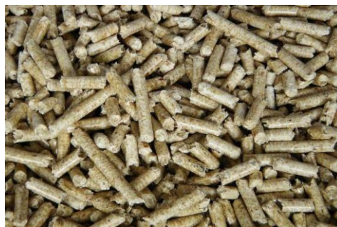
Рисунок 1.1 – Пеллеты [5]

горения и главное не выделяют вредных веществ в атмосферу, не нарушают экологию окружающей среды.