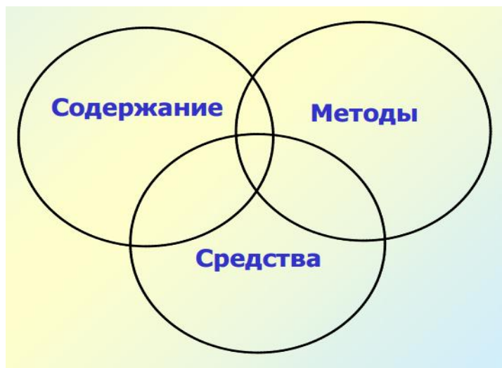
Рисунок 2. Современная технология обучения.

Для того чтобы достичь целей в обучении используется современная технология обучения.