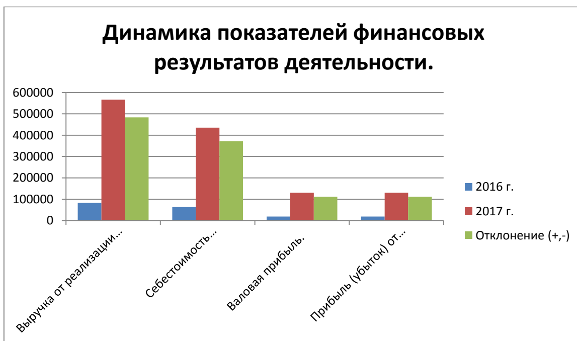
Рисунок 3 – Динамика показателей финансовых результатов деятельности.

На данном ИП особое внимание уделяется внимание реализации, внутренним перемещениям, и поступлениям.