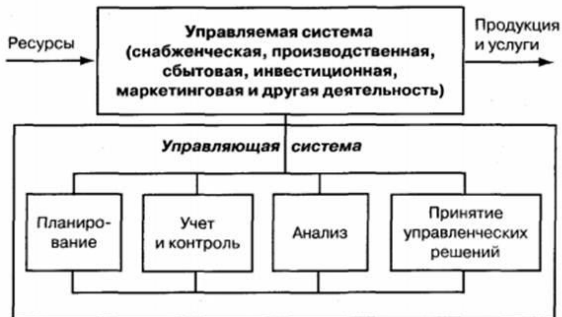
Рисунок 1- Функции анализа хозяйственной деятельности.