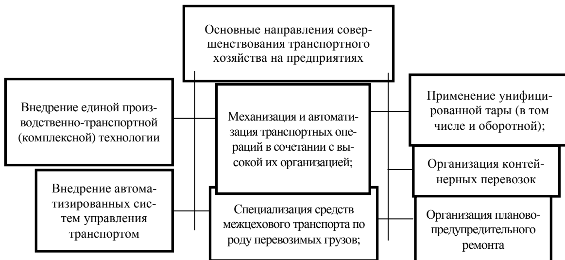
Рис.2 – Основными направлениями совершенствования транспортного хозяйства на предприятии

При отлаженной работе транспортных подразделений предприятия, их сотрудникам необходимо постоянно искать новые пути совершенствования своей работы. Основными направлениями совершенствования транспортного хозяйства на предприятии представлены на рис. 2.