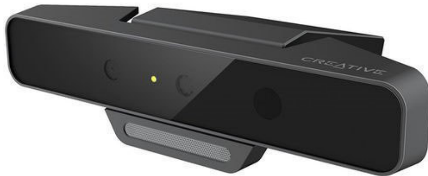
Рис. 2. Камера Intel RealSense SR300

Для реализации цели первоначально требуется создать алгоритм, позволяющий распознавать статические жесты, т.е. жесты дактильной азбуки. Одной из главных задач при создании алгоритма будет работа с фотографиями. Применение камеры RealSense дает возможность получать изображение «глубины». Это свойство позволит не обрабатывать кадры вручную, а производить операции с готовыми изображениями, что ускорит процесс перевода. Каждый человек индивидуален и жесты, которые они показывают тоже будут отличаться. При этом один человек, показывая жест несколько раз, может воспроизводить его по-разному. Отличия могут быть в положении рук, их высоте и углу поворота. Изображение с камеры глубины поможет частично решить данную задачу. Еще одним нюансом является то, что тело человека, показывающего жест, создает шумы. Камера глубины помогает их отсеять, а также убрать другие объекты, расположенные вблизи. После данных обработок на изображении останутся только нужные нам области, которые и будут идентифицироваться в дальнейшем как один из статических жестов.