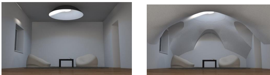
Рисунок 1 – Обычный интерьер со светильником (слева), интерьер с применением подвесной потолочной конструкции (справа)

Конструкция потолочного светильника состоит из осветительной части и абажура. Абажур имеет куполообразную форму, что позволяет усилить иллюзию отверстия, имитируя круглый свод потолка. Помимо установки светильника как самостоятельного устройства, возможно соединение покрытия светильника со стенами помещения, для создания единого подвесного свода. Также возможна установка осветительной части без абажура для монтажа в потолок (рис. 1)