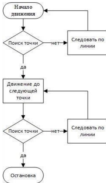
Рис. 2. Блок-схема алгоритма движения пешехода

Заключение. В данной работе был создан программный комплекс, позволяющий производить тестирование алгоритмов движения беспилотного автомобиля в виртуальном полигоне.