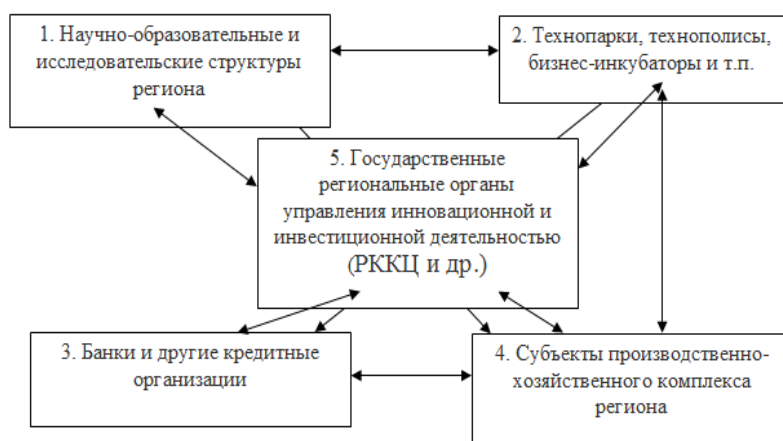
Рисунок 5 – Модель региональной сетевой структуры

Модель сетевой структуры. Следующая модель не привязана к какой-либо форме объединения акторов региональной инновационной системы. Модель отличается авторская группировка участников сетевого взаимодействия и детально обозначенные направления связей в сетевой структуре.