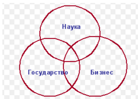
Рисунок 1 – Схема Тройной спирали

Схожая тройной спирали модель оценки взаимодействия акторов была предложена Зарайченко И.А., которая рассматривает сферы пересечения интересов между системообразующими элементами в инновационной сети (рис.2).