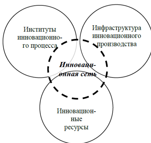
Рисунок 2 – Системообразующие элементы инновационной сети

Схожая тройной спирали модель оценки взаимодействия акторов была предложена Зарайченко И.А., которая рассматривает сферы пересечения интересов между системообразующими элементами в инновационной сети (рис.2).