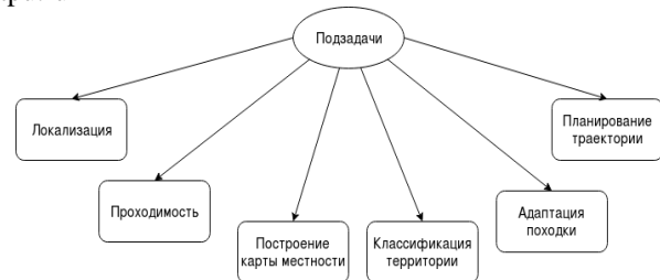
Рис. 2. Классификация подзадач задачи навигации

Исходя из условий экстремальной outdoor робототехники можно выделить следующие подзадачи навигации (Рисунок 2).