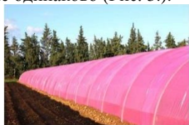
Рис. 3. Фотолюминесцентные пленки для парника

В опыте проведенном в ТГПУ города Томска [8] было выявлено что под флуоресцентными пленками – интенсивное развитие репродуктивных органов, сопровождающееся формированием плодов лучшего качества, и удлинение сроков вегетации растений в среднем на 14 суток. А так же компания PhotoFuel провела ряд исследований, чтобы подтвердить целесообразность использования таких покрытий для теплиц. Эксперимент заключался в следующем: различные культуры были высажены под фотолюминесцентными пленками - и для контроля, под белыми и черными обычными парниковыми покрытиями. Исследование показало, что разработанные фотолюминесцентные пленки способствовали увеличению массы растений в среднем на 30%. Разные культуры реагировали на условия выращивания не одинаково (Рис. 3.).