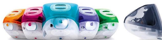
Рис. 2. Первый монитор iMAC – пример новой технологии с внедрением в дизайн опыта пользования

Также проблема восприятия особенно актуальна для производства и внедрения в общество новых инновационных технологий. Человек, приобретая такое изделие, может искаженно трактовать его, так как не имеет опыта взаимодействия с ним. Так, прогнозируя данную проблему восприятия, создатели первого монитора iMAC (см. рис. 2) в его дизайне применили ручку с той целью, чтобы конечный пользователь смог интуитивно принять данный объект и начать с ним контакт на основе опыта пользования [3].