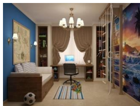
Рис. 3. Третий вариант цветового решения

Вариант третьего цветового решения для детской комнаты ребенка дошкольного возраста представленный на рисунке 3, можно оценить как не совсем удачным. Данное цветовое решение интерьера помещения скорее подходит для подростка.