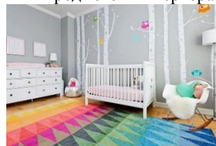
Рис. 1. Первый вариант цветового решения Белый и светло-серый хорошо и гармонично смотрятся с контрастными цветами.

Первый вариант, представленный на рисунке 1, хорош тем, что сочетает нейтральные стены с ярким акцентным предметом интерьера на полу.