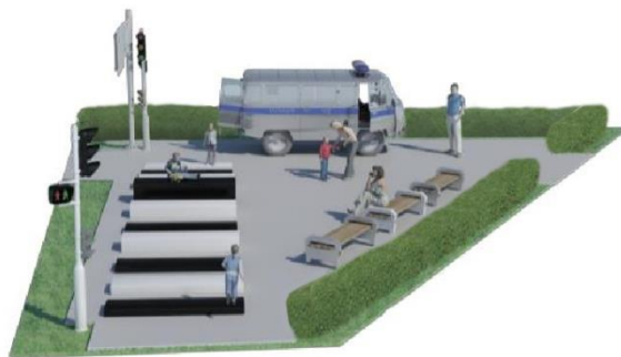
Рис. 2. Общий вид проектируемой игровой площадки

По правилам безопасного расположения детских игровых зон, минимальное расстояние от транспортной магистрали до детской зоны отдыха должно составлять не менее 2 метров от дороги [4]. Проектируемая детская интерактивно-тематическая площадка находится на расстоянии 25 метров от дороги и с этой стороны отделена зеленым ограждением в виде кустарников, высотой 0,7 метра, что не мешает родителю отслеживать ситуацию на остановочном пункте, а также не закрывает собой тематическую зону от пешеходов.