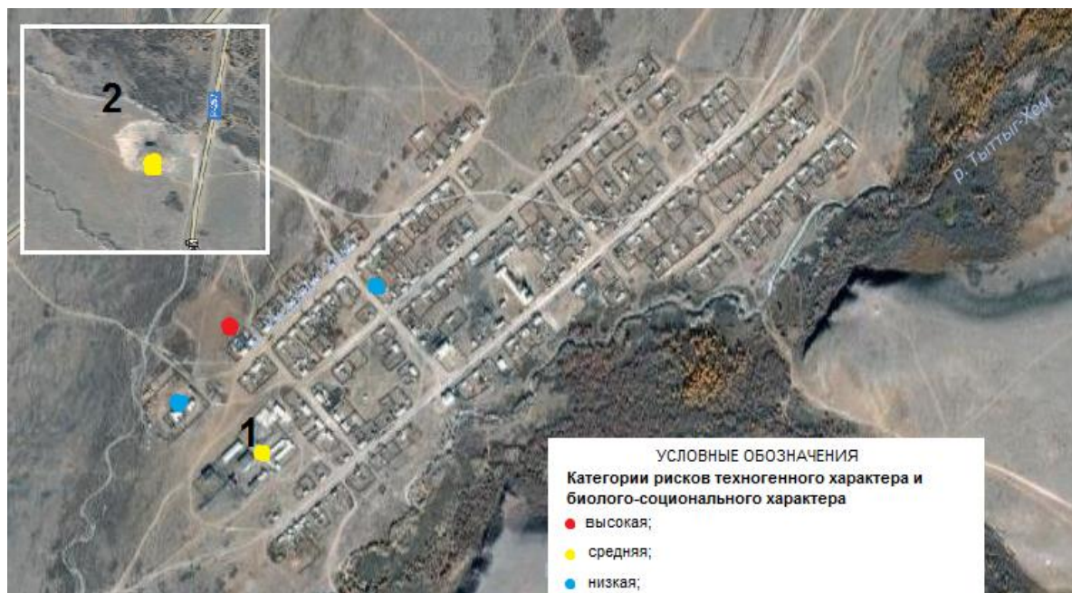
Рис. 4. Риски техногенного и биолого-социального характера в селе Бельдир-Арыг

В результате проведенного исследования можно сделать следующие выводы.