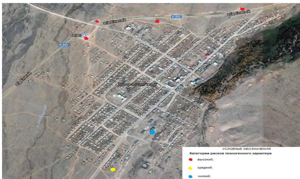
Рис. 3. Риски техногенного характера в селе Самагалдай

Из действующих производственных предприятий в населенном пункте функционирует государственное унитарное предприятие «ЧОДУРАА», цех по производству бетона и пенополистеролбетона. Риски техногенного характера в селе Самагалдай представлены на рис. 3.