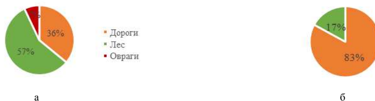
Рис. 3. Причины пространственных характеристик земельных участков на территории ТО (а) и РХ (б)

Установлено, что на конфигурацию земельных участков в ТО влияют преимущественно наличие лесных массивов и оврагов; на территории РК – дороги (рис. 3).