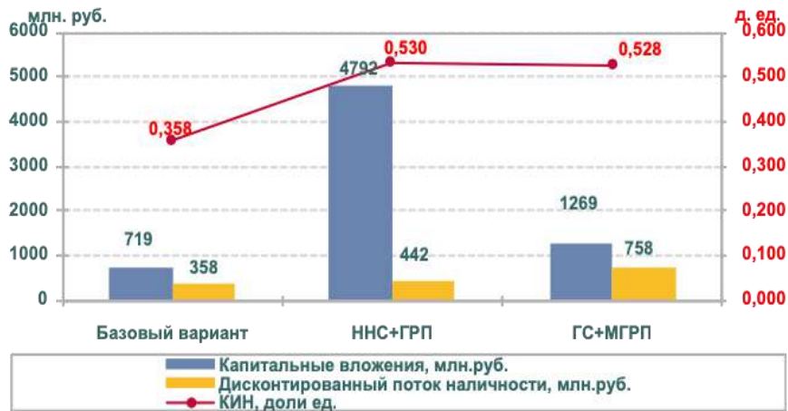
Рис. 2. Результаты расчета экономической эффективности вариантов уплотняющего бурения

Для подтверждения эффективности использования горизонтальных скважин с многостадийным гидравлическим разрывом пласта была произведена дополнительная оценка на основе интегрального показателя оптимальности. Данный метод учитывает нормированный коэффициент извлечения нефти, нормированный чистый дисконтированный доход и нормированный дисконтированный доход государства [3]. На рисунке 3 можно наблюдать, что наибольший экономический эффект по результатам расчета интегрального показателя оптимальности достигнут в случае использования горизонтальных скважин в качестве уплотняющего бурения.