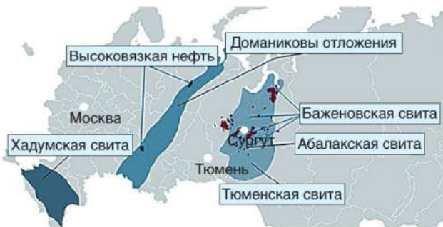
Рис. Расположение основных групп трудноизвлекаемых запасов нефти в России

Таким образом, основные объемы добычи нефти в России с нулевой налоговой ставкой составляют тяжелые высоковязкие нефти, залегающие на территории республик Коми и Татарстана, а также трудноизвлекаемые запасы Ставропольского края (хадумская свита), Ханты-Мансийского АО (абалакские, баженовские отложения) и нефти доманиковых отложений в Татарстане (рисунок).