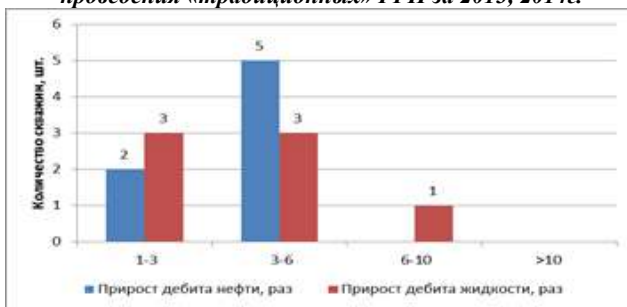
Рис. 2 Распределение прироста дебита нефти, жидкости после проведения ГРП + ГПП, ГРП со сверхлегким пропантом за 2013, 2014 г.

изменение обводненности представлены на рисунках 1 – 3 [1].