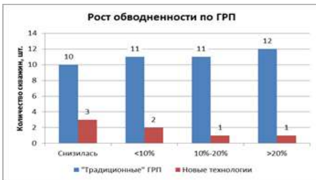
Рис. 3 Изменение обводненности на скважинах после проведения ГРП за 2013, 2014 г.

изменение обводненности представлены на рисунках 1 – 3 [1].