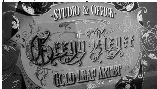
Рис. 1. Пример использования готического шрифта в полиграфии

Первым этапом в создании видеоролика было изучение информации о готической каллиграфии. Готическая каллиграфия — стиль латинского письма эпохи средневековья, распространенный в ряде европейских стран с середины XII до XVII веков и давший начало готическим шрифтам в латинице [1]. На данный момент готическая каллиграфия особенно популярна, нередко при создании полиграфической продукции используют готический шрифт (рис.1).