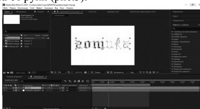
Рис. 3. Анимация текста

Этап подготовки графических материалов сменился процессом создания анимации. В программе Adobe After Effects анимировались такие показатели, как положение, масштаб, непрозрачность и обводка текста. С помощью инструмента «перо» обводился анимируемый текст и с помощью настройки эффекта «обводка» создавался эффект написания текста от руки (рис.3).