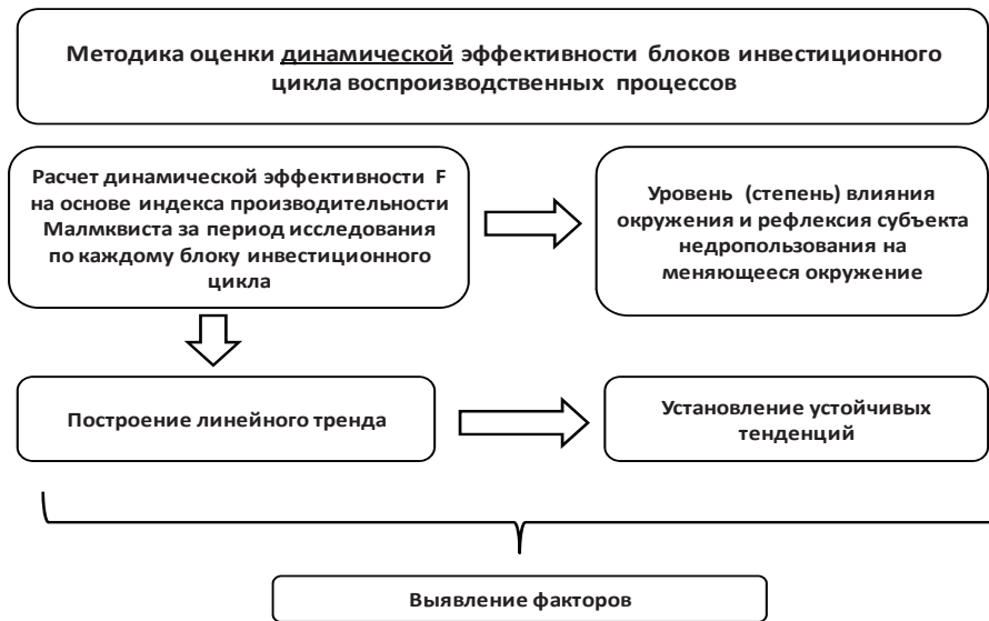
Рис. 2. Методика исследования