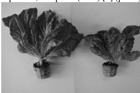
Рисунок 1 – Салат, выращенный под динамическим освещением (слева) и статическим (справа)

Исследования, проведенные с растениями салата показали, что по параметрам морфогенеза: общая масса надземной части (листьев и стебля), корней, высота растений и площадь листьев растений, выращенных при динамическом режиме освещения были значительно выше (ФТ1), чем при стационарном (ФТ2) [2] (рис.1)