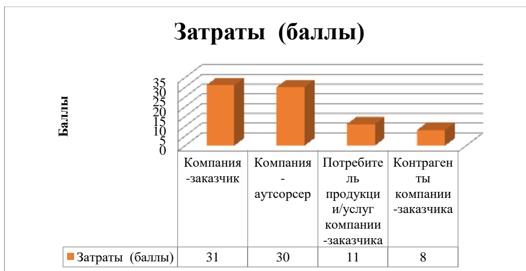
Рисунок 3 – Несение затрат причастными сторонами при внедрении аутсорсинга