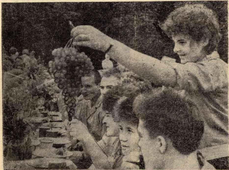
«За целинным столом». Фотоэтиюд С. Александрова.

Редколлегия институтской газеты «За кадры» приглашает вас, первокурсники.