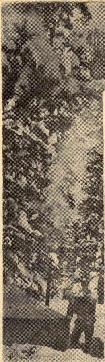
Красивы дремучие и заснеженные леса Горной Шории!

«Дорогим томичам, открывателям кратеров. Пусть ваши северные картины будут жаркими и взрывчатыми.