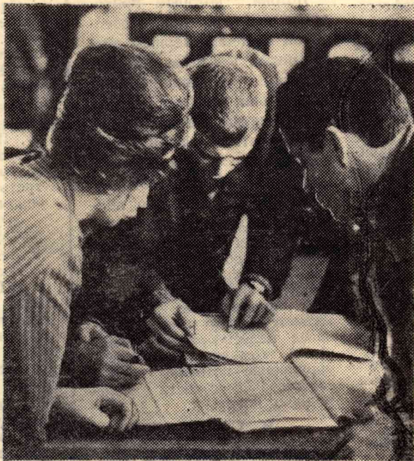
Обычная для нас картина, не правда ли?

Сейчас в НИИ электронной микроскопии оформляется новый заказ на проектирование бетатронной лаборатории на одном металлургическом заводе. Научным руководителем этой темы является доцент, кандидат технических наук В. И. Горбунов.